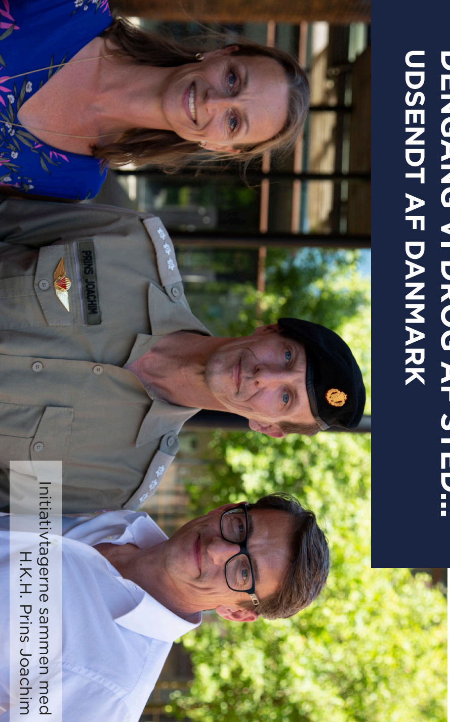
Initiativtagerne sammen med H.K.H. Prins Joachim