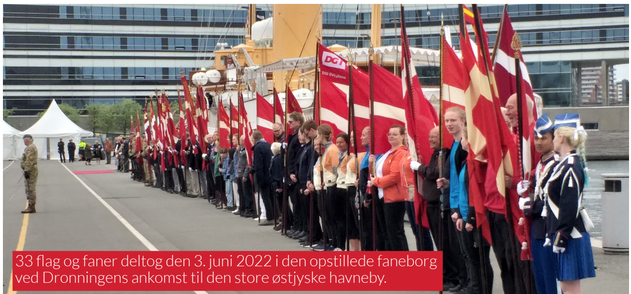
33 flag og faner deltog den 3. juni 2022 i den opstillede faneborg ved Dronningens ankomst til den store østjyske havneby.