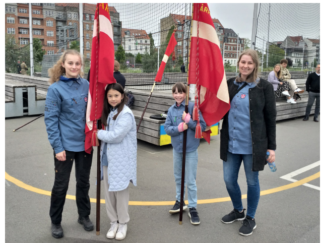
Blandt deltagerne ved faneborgen på Honnørkajen i Aarhus var de fire FDF piger de yngste.

Bortset fra den umådelig lange og kolde ventetid var der almindelig glæde blandt deltagerne over at have været med til at gøre dagen festlig og for at være så tæt på Maje-stæten.