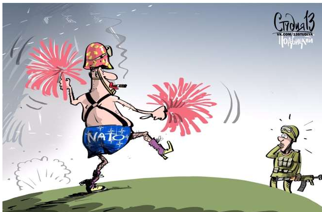
Karikaturtegning af Vitaly Podvitski for det russiske Sputnik News visende NATO som latterlig, og absurd i færd med at angribe Rusland.

14 Den vestlige ide er, at staten er folkets tjener. Putinismens ide er derimod, ligesom Zartidens og Kinas Kommunistpartis, at folket er statens tjener. Det skaber en dyb ideologisk modsætning til Vesten.