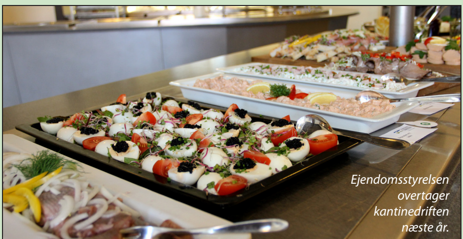
Ejendomsstyrelsen overtager kantinedriften næste år.

stederne og i operationsrummet, hvor den samlede driftsstatus følges.