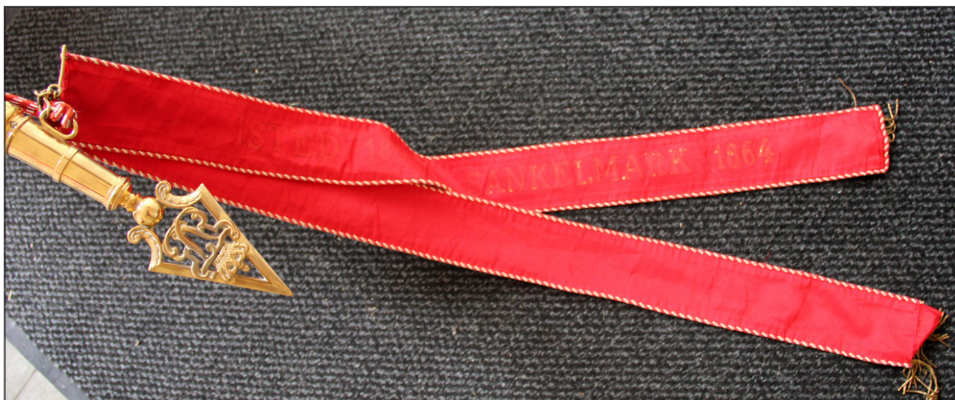
Fanebåndene er, som det ses på fotoet, over tid blevet tekst- og historieløse. Et prioriteret projekt i soldaterforeningen!

Der er i første omgang taget initiativ til at få vurderet et økonomisk behov som forudsætning for projektet.