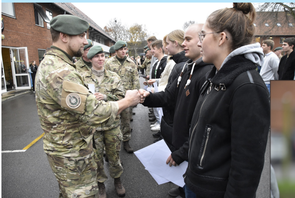
35 værnepligtige siger farvel til Forsvaret efter fire måneder på Vordingborg Kaserne.

Torsdag den 25. november 2021 var der afskedsparade for dette års Hærens Basisuddannelses hold to.