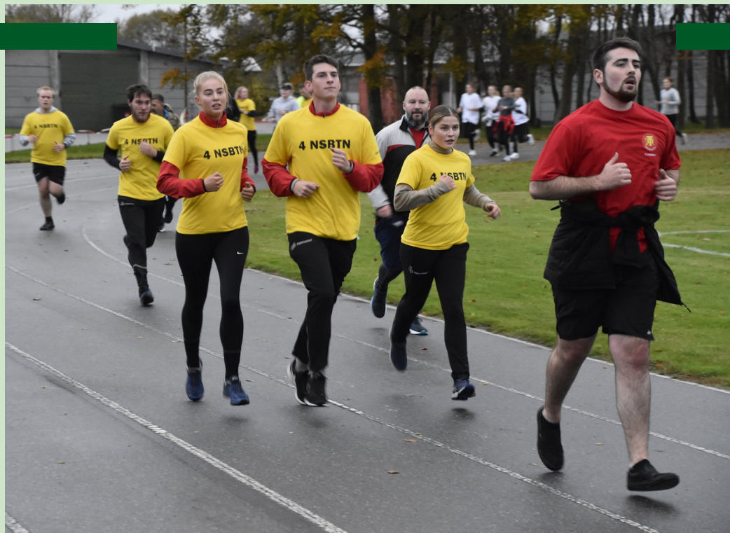
Traditionen tro begyndte Trænregimentets idrætsdag med et 3.000 meter løb.

I år kunne Trænregimentets logistiktropper ligeledes markere, at man nu i 70 år har været en selvstændig våbenart med ansvar for logistik og militærpoliti. Tidligere har logistikenheder været underlagt henholdsvis Artilleriet og Rytteriet, hvilket farvene karmoisinrød og sølvgrå i regimentets våbenskjold symboliserer.